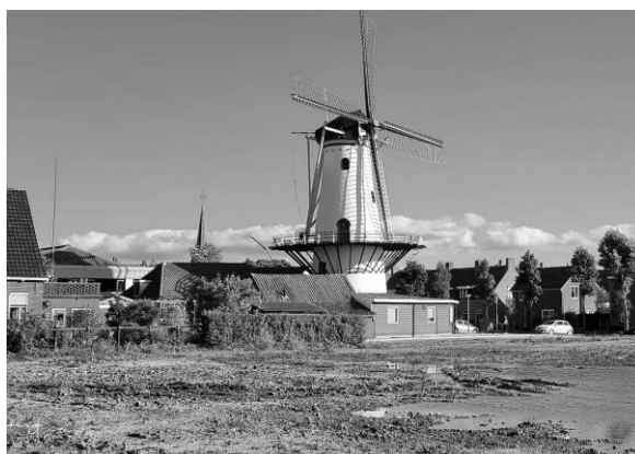
Onze molen 2022.