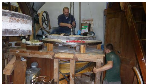
Reparatie aan de maalstoel.

Het “op de wind malen” met onze molen was gezien het roedeprobleem na 22 maart niet meer mogelijk. Gelukkig staat er op de begane grond nog een elektrisch aangedreven koppel maalstenen, waar overigens de afgelopen 12 jaar niet of nauwelijks naar omgekeken is. Met behulp van de molenmaker, de Restauratiewerkplaats Schiedam, werd deze maalstoel weer gangbaar gemaakt zodat we maar korte tijd niet in staat waren om zelf onze tarwe te malen. Rob Batenburg, de voormalige bedrijfsleider van de molenmakerij, was bereid om geheel “om niet” het scherpstel van de