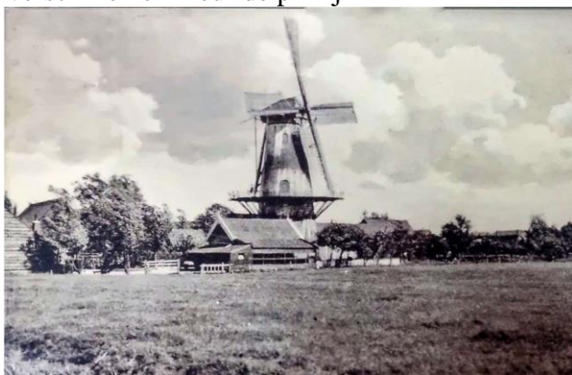
Onze molen voor 1930.

De onderstaande twee foto's zouden door kunnen gaan onder het motto van: “Zoek de zeven verschillen en kleur de plaatjes”.